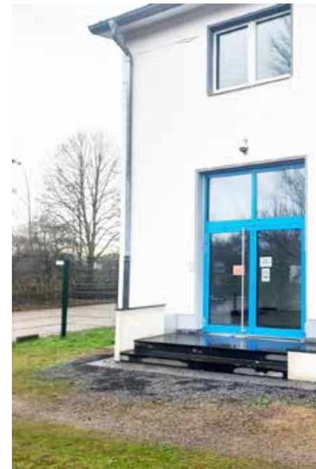
Die neue Eingangstür des Athleticons. Im Hintergrund sieht man den Neckarpfad.

von 14.00-ca. 18.00 Uhr – nein es ist kein Aprilscherz – laden wir daher alle Mitglieder sowie Interessierte ein, unser Athleticon zu besichtigen. Es warten Mitmachangebote und sportliche Auführungen. Gegen den kleinen Hunger wird natürlich ebenfalls vorgesorgt. Auch die Calisthenics-Anlage, die mit ihrer Inbetriebnahme Mitte März 2022 nur ca. zwei Monate älter ist als das Athleticon, kann an diesem Tag unter fachlicher Anleitung genutzt werden. Also: Save the Date! Familie, Freunde, Nachbarn einpacken und vorbeikommen am 1.4.2023. Der Vorstand, alle Mitarbeiter*innen sowie Trainer*innen freuen sich auf Sie und Euch!