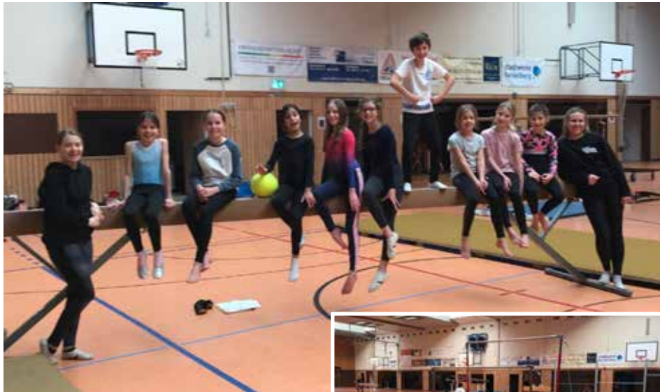
Gruppenbild mit „Herr“ – die zehn „Damen“ und der eine „Herr“ hatten großen Spaß

täglichen fünfeinhalb Camp-Stunden bestens zu füllen. Neben dem vorrangigen intensiven, gerätturnspezifischen Training sorgten Teamspiele und Geschicklichkeitsparcours für genügend Abwechslung, so dass die Zeit nie lang wurde. Am letzten Tag konnten sich die Eltern einen Eindruck vom Erarbeiteten verschaffen. Die Turnerinnen boten einzeln oder paarweise kleine Turn-Kür-Aufführungen dar, die sie sich in den Tagen zuvor selbst erdacht hatten. Alle Akteurinnen waren sich einig: Anfang Januar 2024 wollen wir wieder NICHT ausschlafen!!!