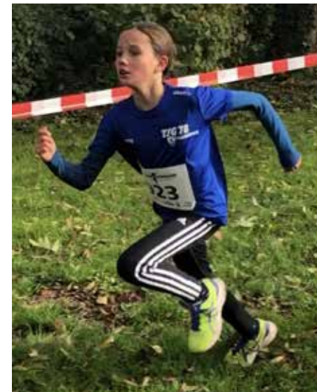
Romy kann sich schon bald von der Masse absetzen und sichert sich die Silbermedaille

Aktuelles von und aus der weiten Welt der TSG 78-Leichtathletik finden Sie / findest du auch auf unserer Internetseite www.tsg78-hd.de/leichtathletik