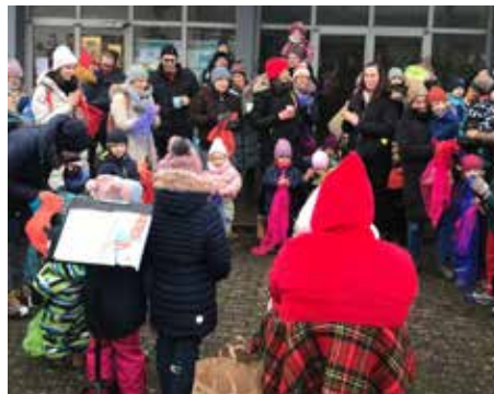
... und bekam von den Kinderturnkindern ein tolles, sportlich-musikalisches Programm geboten.