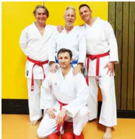
Das TSG 78 Karate-Wettkampfteam in Mörlenbach