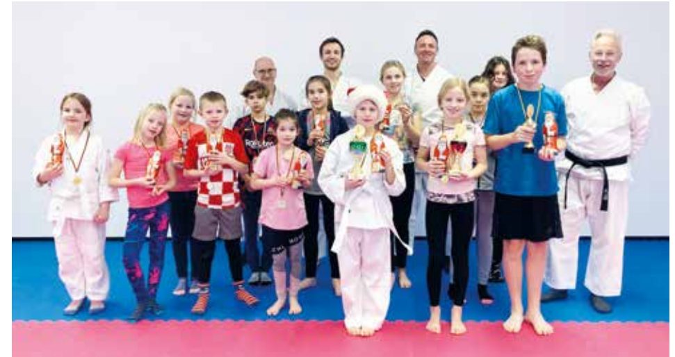
Viel Spaß hatten unsere jüngsten Karatekas beim Nikolausturnier im Dezember 2022

Für die jüngsten Karatekas wurde von der Abteilung ein Nikolaus Turnier und eine Leistungsstands Prüfung im Dezember abgehalten. Beide Veranstaltungen wurden mit Freude besucht und bereiteten unseren Karate Kids viel Spaß und noch mehr Motivation für das neue Jahr!