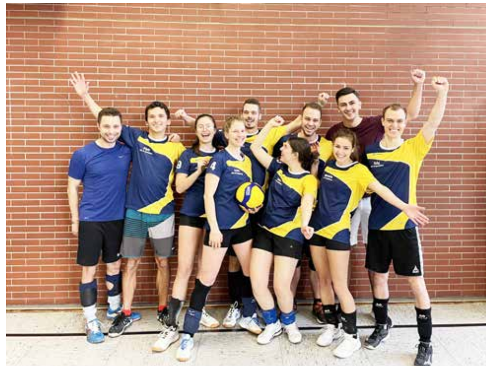
Auch bei verlorenen Spielen war immer gute Laune im Team „Reisegruppe Sonnenschein“