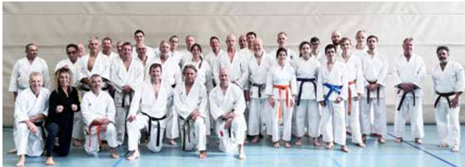
Unser erster öffentlicher Wado-Lehrgang in Heidelberg

graduierten Karatelehrern, sowie einem tollen, themenreichen Programm, liefen die Trainingseinheiten über sieben Stunden und haben allen Teilnehmenden viel Spaß bereitet.