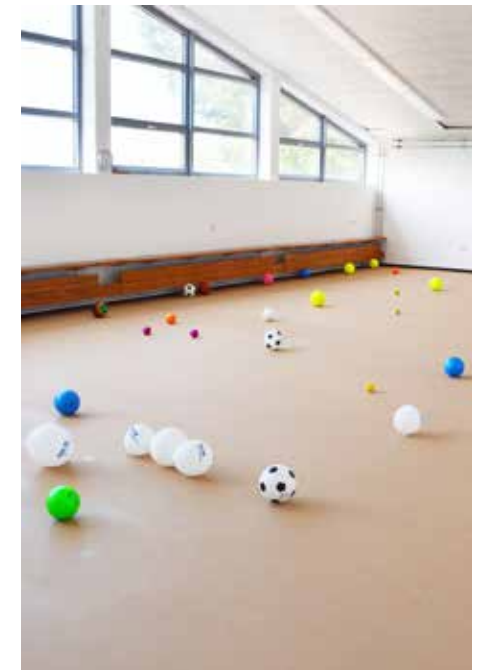
Die obere Halle des Athleticon – Heimat der Ballschule (wie man sehen kann), der Karate-Abteilung und des Rehasports.