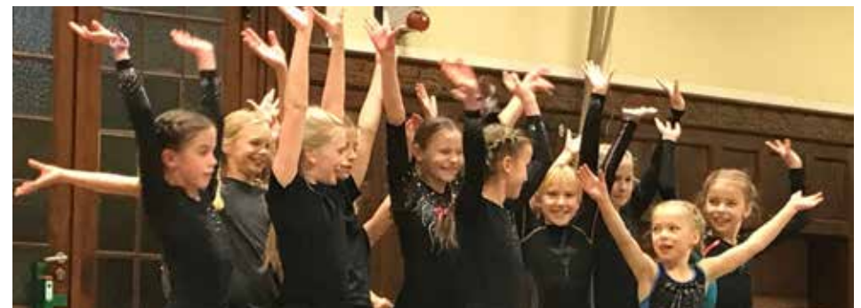
... und hatten sichtlich großen Spaß dabei.