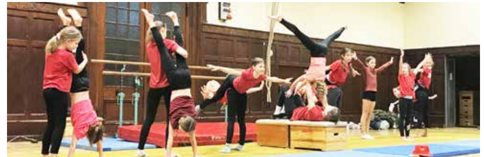
Mit turnerisch-tänzerischen Choreografien begeisterten unsere Turnerinnen ihr Publikum...

merken, sondern während der sie sich zudem bestens aufeinander abstimmen mussten. Sonst hätten akrobatische Elemente wie Menschenpyramiden oder Flugrollen im Doppelpack auch daneben gehen können. Gerätturnen ist eben auch ein Teamsport. Nach den Darbietungen aller Gruppen wurde es dann noch besinnlich. Zu dem wunderschönen Adventslied „Gold`nes Licht in uns`rer Mitte“ von Dorothee Kreusch-Jakob ließen die Turnerinnen, die sich in vier Grüppchen zusammengestellt hatten, anhand von LED-Lichtern lebendige Adventskerzen entstehen. Ein kleiner magischer Moment! Trubeliger wurde es abschließend im Foyer des Schulgebäudes, wo alle sich bei Gepäck, Kinderpunsch und Glühwein noch plaudern zueinandergesellten.