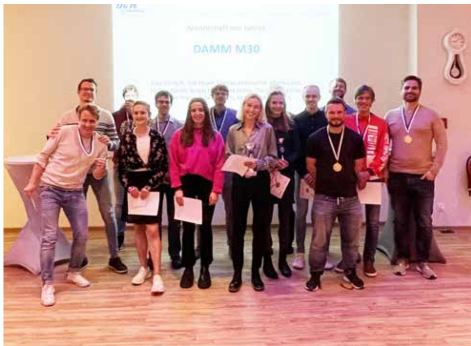
Die Geehrten der Jahresabschlussfeier 2022