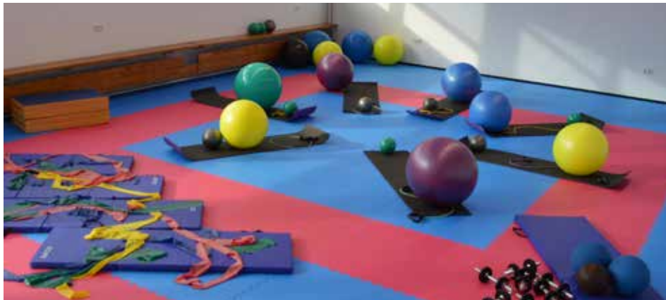
Die Halle und die vielseitige Ausstattung warten auf die Teilnehmer*innen des Rehasports