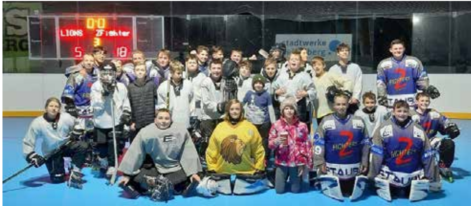
Unser Team zusammen mit den Z-Fighters aus der Schweiz

stützung der Elternschaft bzw. die der ersten Mannschaft. Ob als Trainer hinter der Bande oder als Zeitnehmer oder Schiedsrichter neben/auf der Platte, alle gaben sich große Mühe. Auch unsere Glühpunsch-Ausschenker sowie Fingerfood-Überreicher/Produzenten leisteten Großes. DANKE DAFÜR.