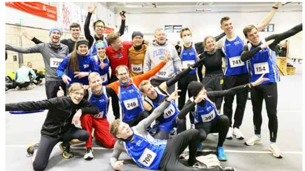
Die erfolgreiche TSG 78-Meute in Rheinzabern