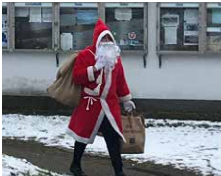
Schwer bepackt stapft der Nikolaus heran ...

viele Kinder besucht habe.“ Zunächst bekam der hohe Besuch von Kindern und Eltern ein Nikolauslied dargeboten, begleitet von einer jungen Flötenspielerin. Danach kamen die Bewegungslieder, die die Kinder altersweise im Vorfeld in den Turnstunden einstudiert hatten. Ja und dann durften alle endlich ganz nah herauskommen und sich ihr Präsent abholen. Nach einem weiteren Ständchen verabschiedete sich der alte Mann, beeindruckt von der Bewegungsfreude unserer Kitu-Kinder, wieder. „Bis zum nächsten Jahr!“, brummelte er in seinen Rauschebart. Eltern und Kinder ließen bei Kinderpunsch, Glühwein und Feuerkorb den Nachmittag dann noch gemütlich ausklingen.