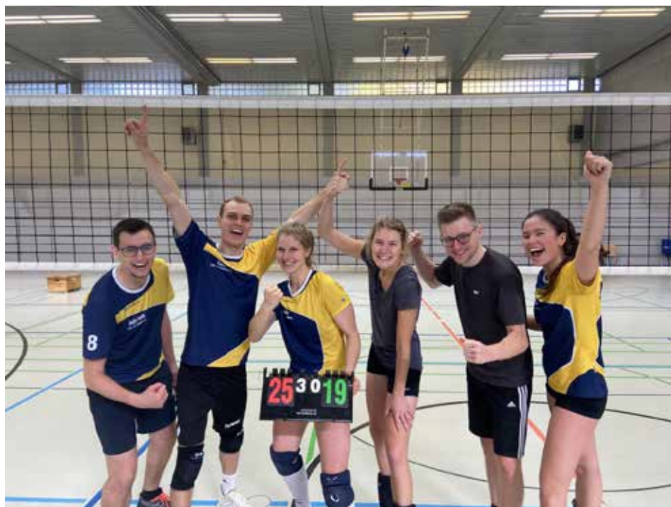
Ein erfolgreicher Saison-Auftakt in Bad Rappenau

Dennoch steht die Reisegruppe Sonnenschein in dieser Saison super da! Überwintert auf dem 3. Tabellenplatz, allerdings mit zwei Spielen mehr als einige Verfolger. Wir freuen uns auf drei weitere Urlaubsreisen mit hoffentlich vielen sonnenreichen Punktgewinnen!