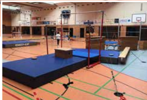
Ein Turnerparadies: Eine große Halle voller Turngeräte!