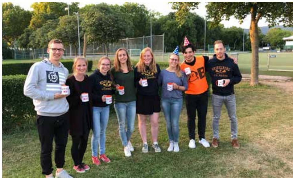
Zum Saisonabschluss wurden Spieler mit besonders tollen Leistungen geehrt und erhielten je eine Tasse

Jetzt freuen wir uns auf den Sommer mit vielen Turnieren und die Vorbereitung auf die nächste Saison.