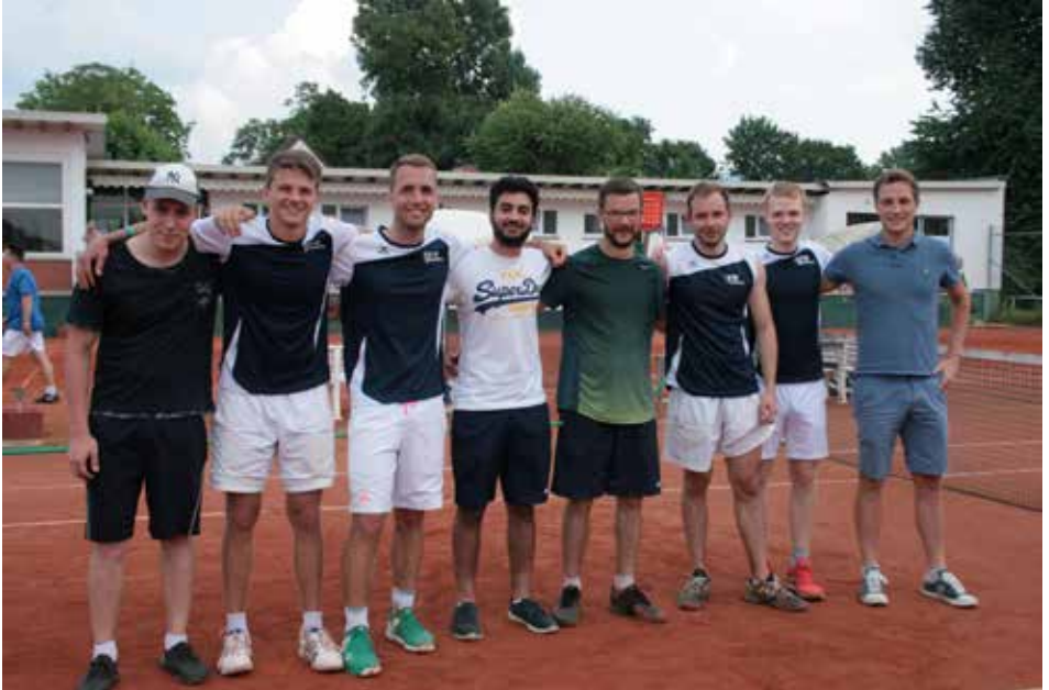
Die Herren 2-Spieler beim 5:4-Sieg gegen den TSV 1949 Pfaffengrund am 10. Juni 2018

man weiß, ist (1.) aller Anfang nicht leicht und sind (2.) die jungen Herren 3-Spieler, die Herren 1-Spieler von morgen! Die 1. Herren (MF Shervin Aghamoradi) können sich bereits jetzt schon freuen: sie haben die berechtigte Hoffnung, in die Bezirksliga aufzusteigen.