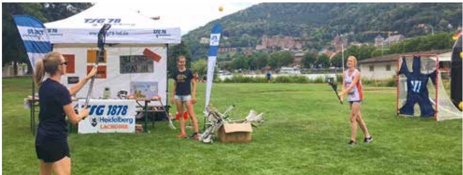
Beim Lebendigen Neckar konnte jeder einmal Lacrosse ausprobieren.

Jugendtraining ab 10 Jahren: Neustart Do, 20.9.18 um 18.00 Uhr