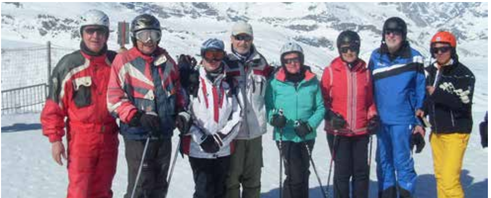
Herrliche Bedingungen am Gornergrat auf 3089 Meter