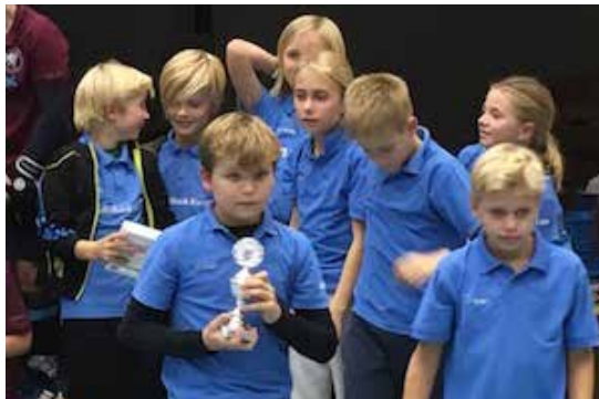
Viel Freude gab es bei den Knaben C über den Pokal beim Turnier in Worms

TSG 1878 Heidelberg – TG Frankenthal II 8:0 / - TG Frankenthal I 0:3 / - TG Worms 9:0 – TEC Darmstadt 1:1