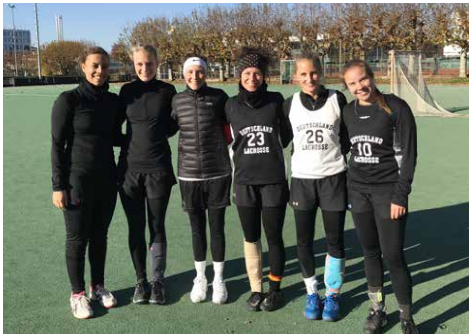
Heidelbergerinnen beim Sichtungscamp der Nationalmannschaft in Frankfurt

Nach einer Woche gab der Trainerstab den erweiterten Kader bekannt, der vom 27.-30.12.2018 in Mannheim ein zweites Mal gesichtet wurde. Erfreulicherweise wurden zwei Heidelbergerinnen für diesen Kader nominiert und die Heidelberger Lacrosser sind mächtig stolz. Ob die beiden Damen auch nach dem zweiten Sichtungscamp weiter um einen Platz für den EM-Kader kämpfen, kann mit Sicherheit in der nächsten TSG-Rundschau nachgelesen werden.