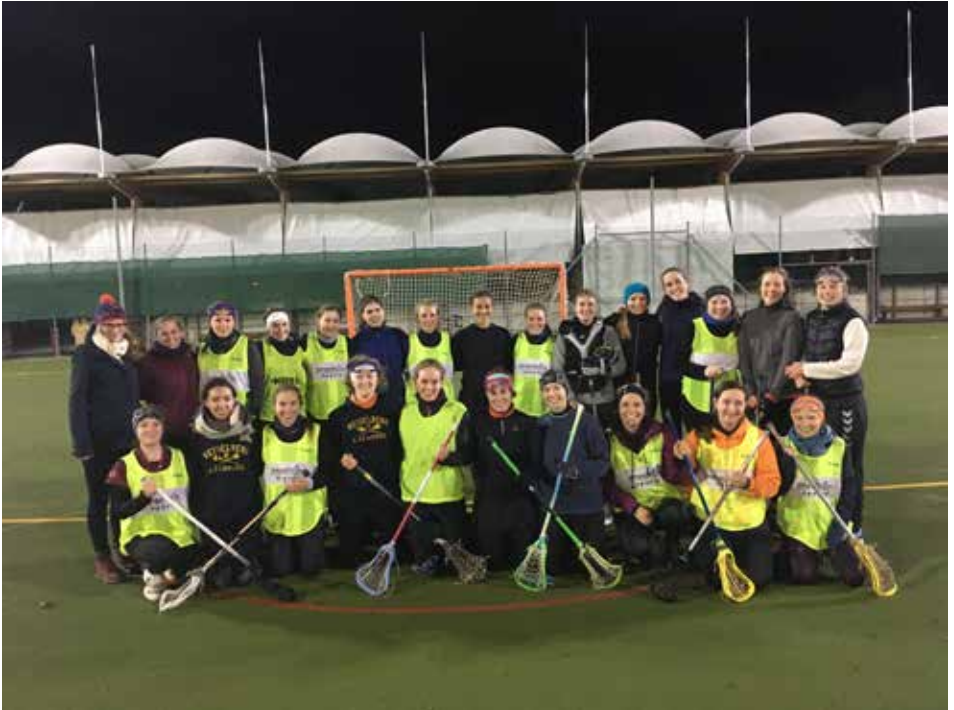
Gemeinsames Mannschaftsfoto mit den Mannheimerinnen nach dem Freundschaftsspiel

Weihnachten ein Freundschaftsspiel gegen die Mannheimer Lacrosse Damen bestritten. Beide Mannschaften hatten viel Spaß und konnten unheimlich viel Lernen. Einer erneuten Auflage steht demnach nichts im Weg.