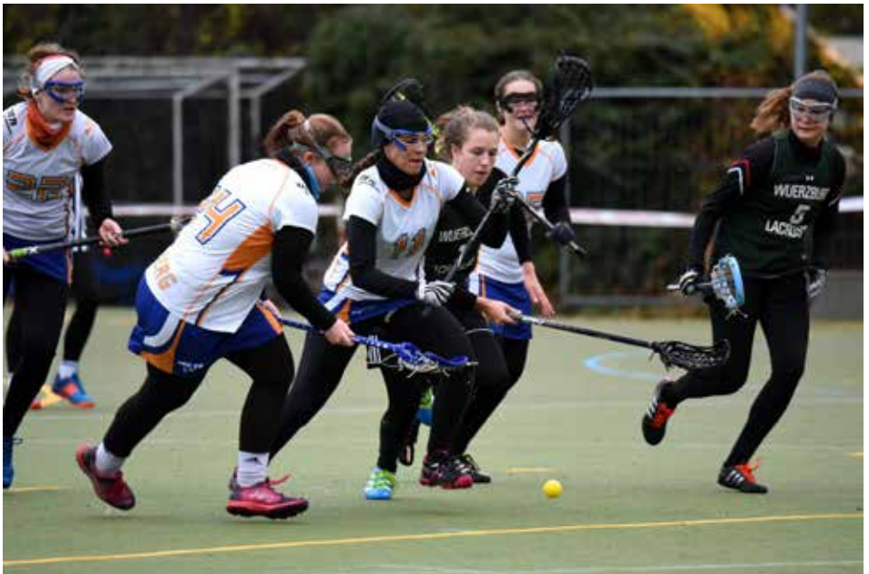
Heidelbergerinnen kämpfen im Spiel gegen Würzburg um den Ball

tatsächliche Leistung der Mannschaft wieder. Die aus vielen neuen Spielerinnen bestehende Mannschaft hatte bereits beim Saisonauftakt gegen Stuttgart (6:6) eindrucksvoll gezeigt, welch Können in ihnen steckt. Allerdings zeichnete sich schon bei diesem Spiel ab, was sich durch alle Spiele hindurchziehen sollte: Dass die Mannschaft stets für