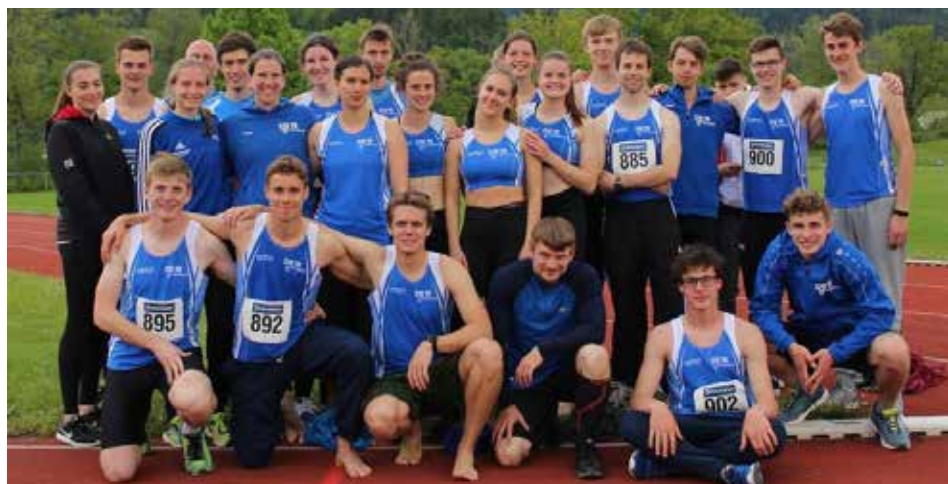
Zwei badische Titel und ein Vizetitel für unsere Mannschaften

Die Ergebnisse sind unter https://ladv.de/ergebnis/datei/48206 zu finden.