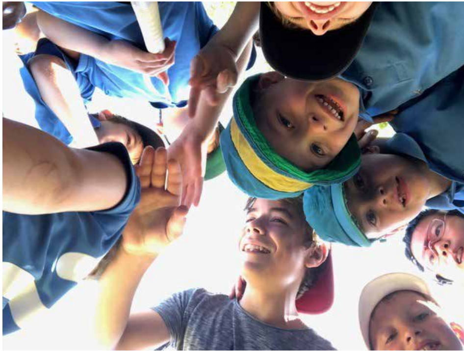
Viele Spaß hatten die Mädels und Jungs der Knaben D beim Übernachtungsturnier in Karlsruhe