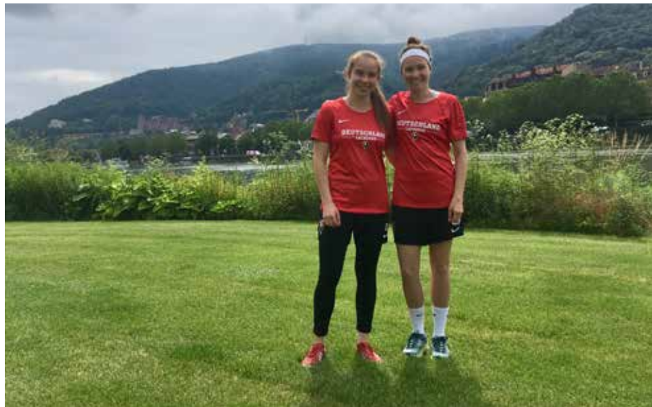
Israel – Here we go! Zwei Heidelberginnen fahren zur Europameisterschaft nach Israel.

Die Heidelberg Lacrosser sind mächtig stolz auf die Beiden und wünschen eine grandiose Zeit.