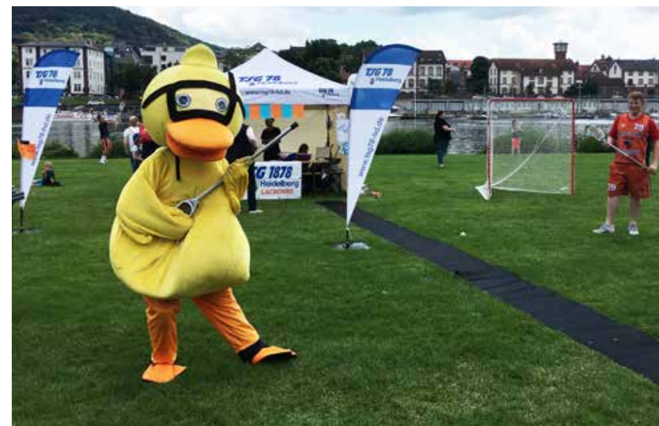
Ente gut, alles gut... die Lacrosse Abteilung konnte beim Lebendigen Neckar erfolgreich Werbung für den Sport machen