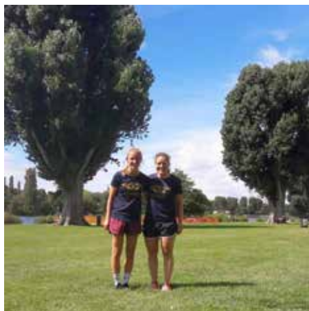
Die Teilnahme am NCT Lauf fand dieses Jahr etwas flexibler statt.