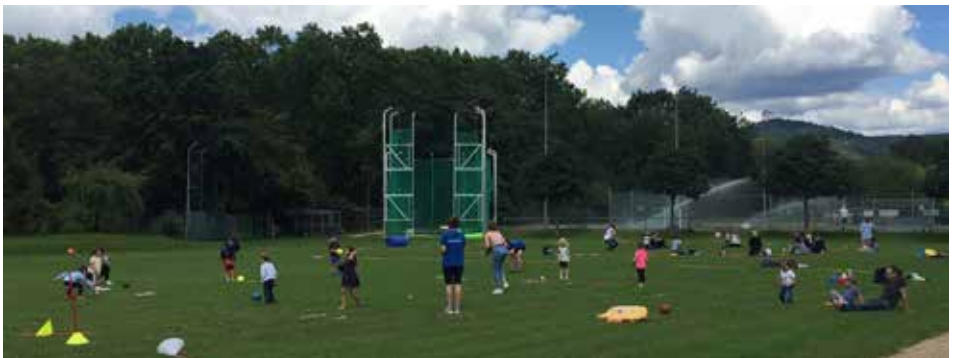
Improvisation war gefragt bei der Verlegung des Kinderturnens nach draußen