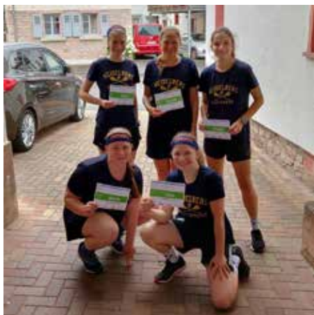
Die Lacrosse Damen sind auch dieses Jahr wieder beim NCT Lauf vertreten.

Jetzt freuen wir uns, dass wir wieder zusammen auf dem Platz stehen können, denn zusammen zu spielen macht einfach am meisten Spaß.